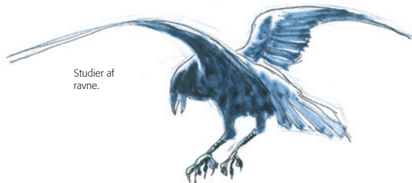
Studier af ravne.